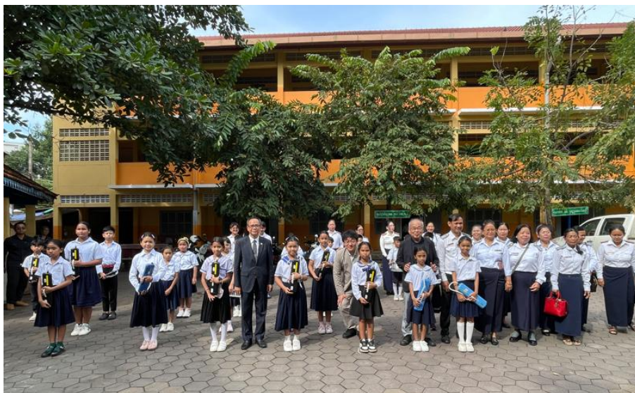
2025 年 10 月 プノンペン市 Baktouk 小学校ブラスバンド (引き渡し式での歓迎風景)