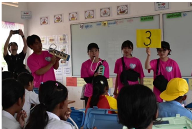
2024 年 8 月 iPVAJ の学生会員による 鍵盤ハーモニカによる音楽交流 (カンボジア王国プレアビハ州スラ エム村小学校)