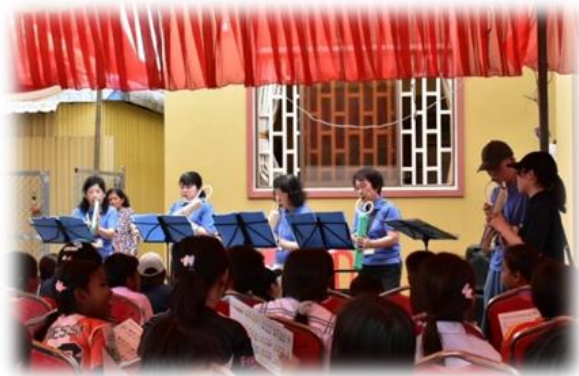
2025 年 2 月 音楽教育専門家グループによる音楽指導 (カンボジア王国タケオ州チマラク村で のミニコンサート)